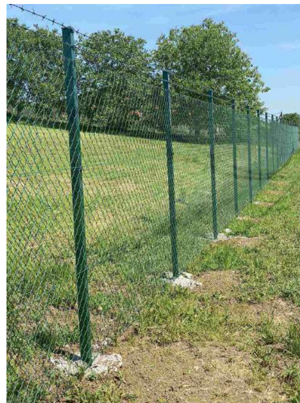
PRIMENA - ILUSTRACIJA

OPIS : Univerzal pletivo izrađeno od komercijalno pocinkovane žice (min. nanos Zn 50-70grZn/m 2 ) pa zatim plastificirana, Ø 2,0/2,80mm sa promerom okca 40x40mm. Pletivo se zateže sa 3 zatezne noseće pocinkovano-plastificirane žice Ø 2,20/3,00mm. U svemu zrađeno po važećim standardima za ovu vrstu robe - SRPS EN 10244-2.