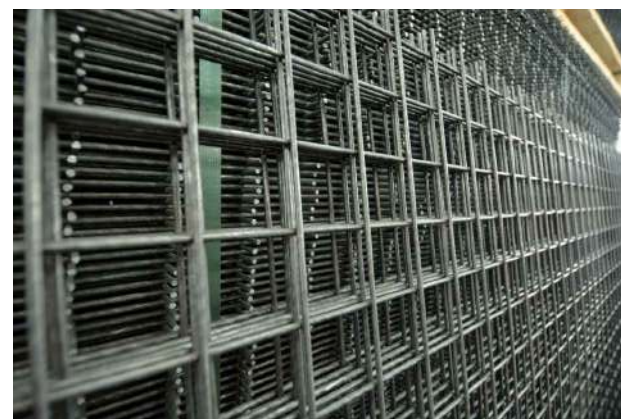
MREŽA U STANDARDNIM TABLAMA