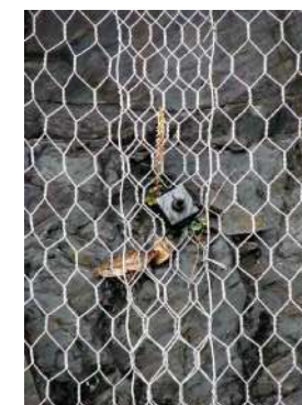
PRIMENA - ILUSTRACIJA