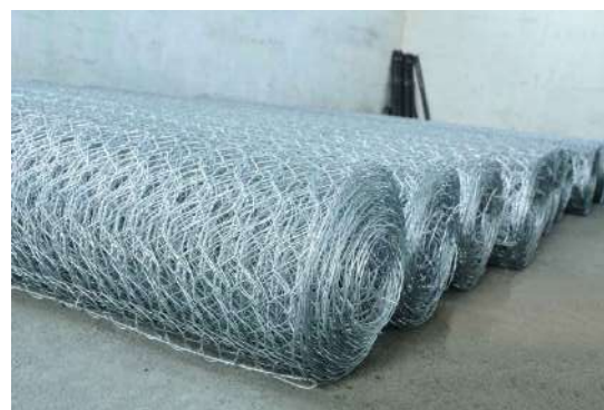
PLETIVO U STANDARDNIM ROLNAMA