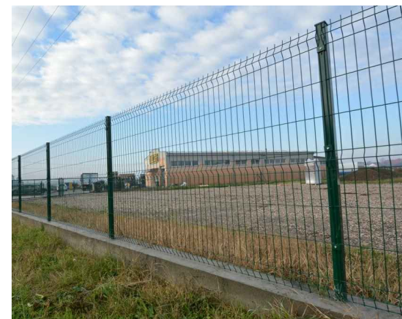
PRIMENA - ILUSTRACIJA